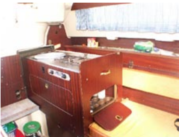
Die Schiebepantry verschwindet bei Nichtgebrauch unter der Cockpitducht und ist mit allem Notwendigen ausgestattet

sen sind leider so klein gewählt, dass das Dichtkurbeln der Genua einiges an Arbeit bedeutet. Unter den Duchten ist ausreichend unterteilter Backskistenraum vorhanden, er fällt bei den Versionen mit Achterkajüte durch die Kojen etwas geringer aus als bei der 75er. An Steuerbord findet sich ein selbstlenzendes Gasflaschenfach. Die Fallen sind vom Mast kommend nach achtern umgelenkt, die