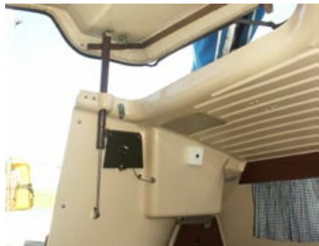
Ein Hubdach sorgt für Stehhöhe und viel Luft unter Deck. Häufig klemmen die Gasdruckfedern, Ersatz ist aber leicht zu beschaffen