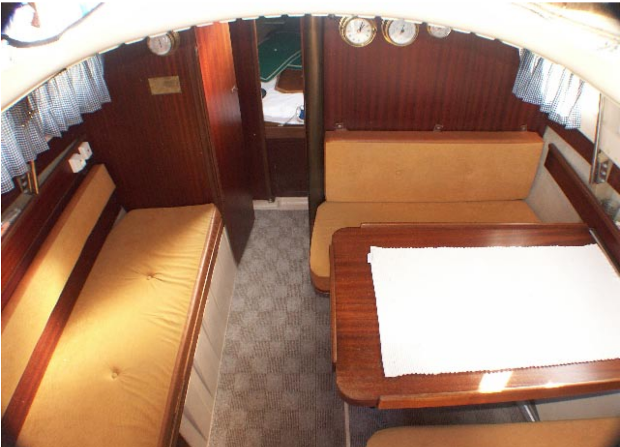
Eine Dinette-Version der Delanta 75. Der Innenraum ist recht schnörkellos, aber durchaus praktisch ausgebaut, die Platzverhältnisse sind für eine drei- bis vierköpfige Crew akzeptabel. Nach dem Absenken des Tisches steht eine weitere Koje zur Verfügung

flache Gewässer gab es optional eine Kielschwertausführung.